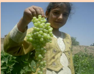
ぶどう再生支援 (アフガニスタン、 2003～)

1995年の阪神・淡路大震災の時に世界から支援をいただいた事から、「困った時はお互い様」を合言葉に海外の被災地支援を始めました。この25年間で世界35の国と地域で63回の復興支援活動を行ってきました。