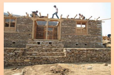
耐住宅再建支援 (ネパール、2015～)