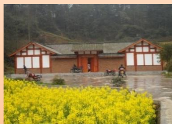
コミュニティ支援 (中国・四川、2008～)