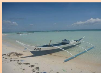
漁業支援 (フィリピン、2013～)